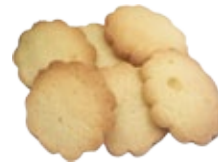
Biscuits au beurre