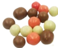
Croustybilles chocolat blanc