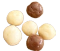
Croustybilles chocolat lait